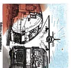
Claude LACAN ROUTE, RAIL, CIEL Artes vitales du Limousin